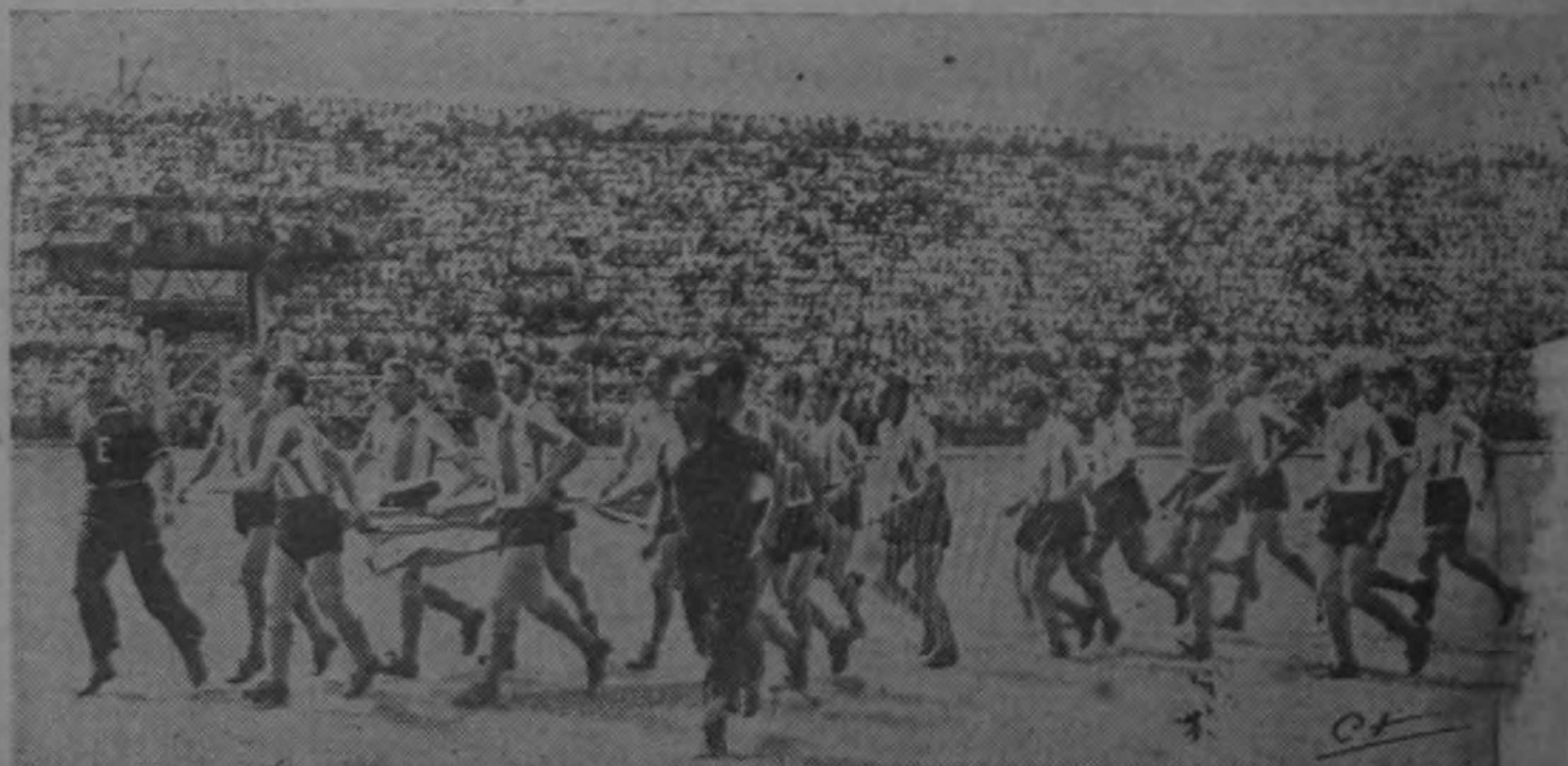
El poderoso conjunto de Racing de Buenos Aires hace su ingreso a la cancha portandera de Costa Rica, en medio de la ovación del público que ocupaba totalmente las graderías.—(Foto Coto).