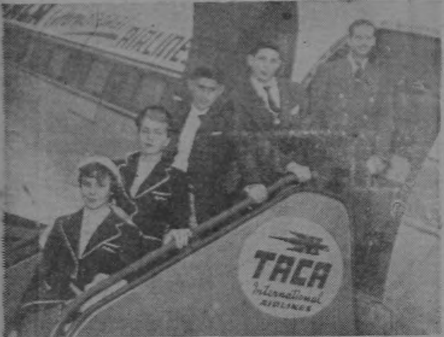
El equipo de nadadores juveniles de Nueva Orleans, dos muchachas y dos muchachos, llegó ayer por vía aérea para participar en el torneo que esta tarde se inaugurará en Ojo de Agua.