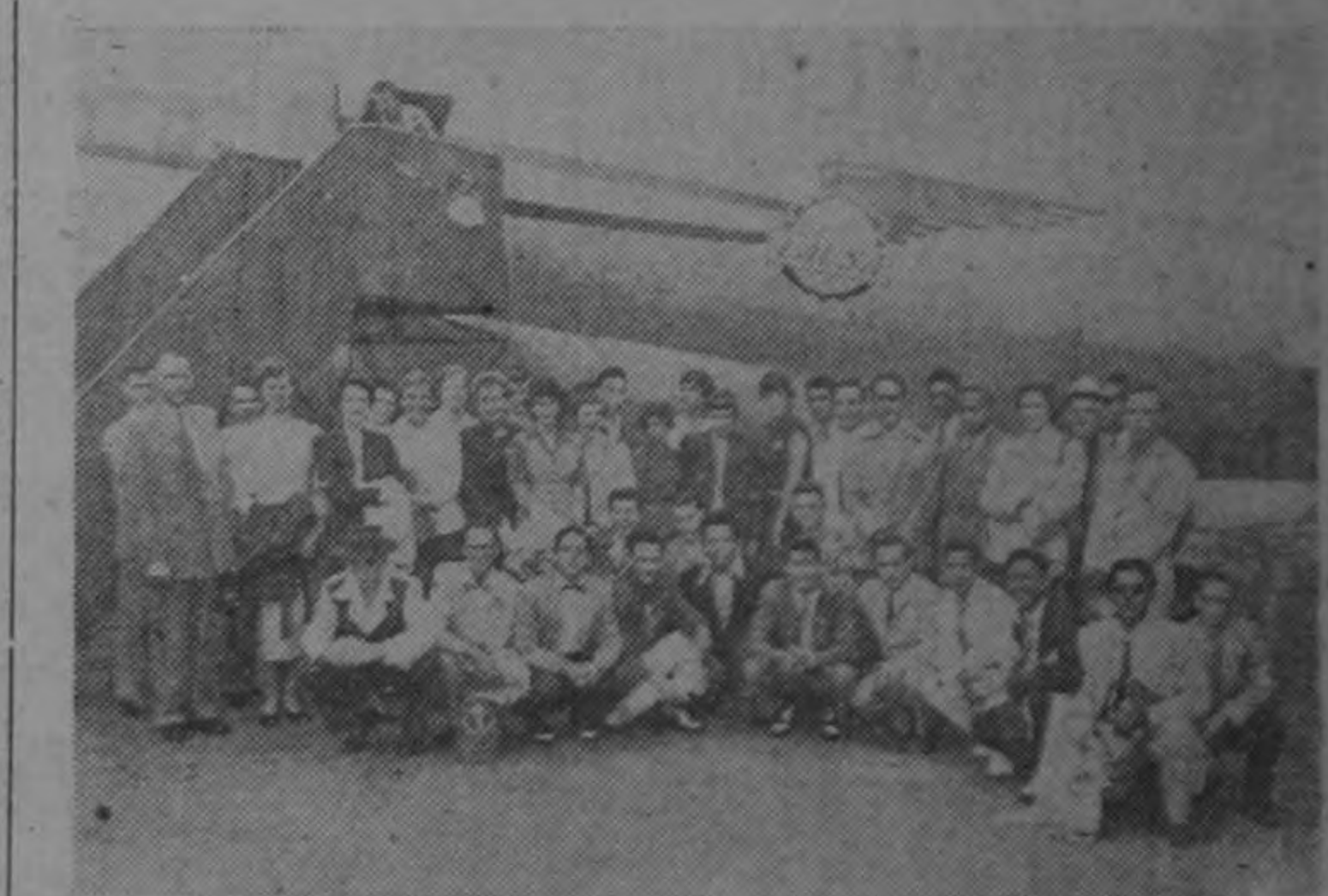
Nadadores de la Zona del Canal y de Panamá, en el aeropuerto de La Sabana, después de haber desembarcado. Tomarán parte en las competencias náuticas de Ojo de Agua.—(Foto Arévalo).